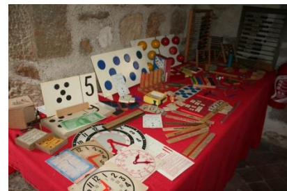
2 fois 1, 2 - 2 fois 2, 4...

Après avoir aménagé trois logements – passage incontournable pour rassurer notre banquier – nous avons œuvré dans la deuxième phase du projet : création dans les anciennes étables d'un espace de 300m 2 classé "Établissement Recevant du Public" ayant une capacité d'accueil de 135 personnes. Pour ce faire, nous avons réalisé des ouvertures, monté des cloisons, coulé des dalles, posé moult canalisations, collé de nombreux paquets de carrelage et de faïence, étalé des litres de peinture... Ainsi, au cours du 2 ème semestre de cette année, ces travaux seront achevés et cet ensemble de salles pourra être loué pour fêter des événements familiaux ou pour animer des formations, il sera également utilisé pour mettre en valeur notre grande collection.