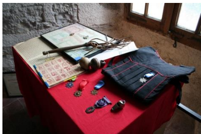
Les médailles ou le martinet !!!

Les thèmes sont si nombreux - calcul, géographie, histoire, habillement, musique, visite médicale, les récompenses, les bataillons scolaires, le mobilier, le cinéma à l'école, lecture,... - pour n'en citer que quelques-uns.