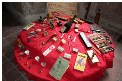
Vous m'avez copiez 100 fois...

Depuis, lors de chacune de nos rencontres, vous êtes un certain nombre à venir nous offrir gentiment les fruits de vos trouvailles : pour qui, un témoignage de satisfaction retrouvé dans le grenier de la maison familiale, pour un autre c'est un buvard retrouvé dans un cahier de l'école communal, fleurant encore un peu l'encre violette et mettant en valeur la boulangerie du quartier.