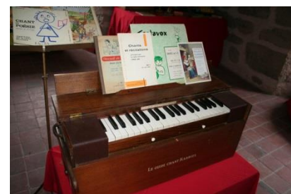
Vous chantiez ? J'en suis fort aisé...