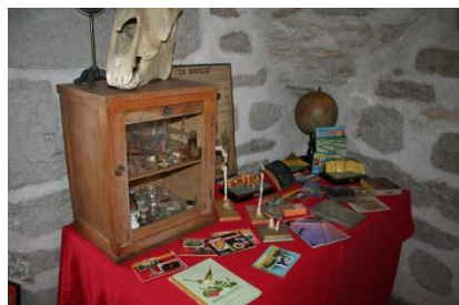
On appelait ça "leçons de choses"

Aujourd'hui, il nous semble important de vous tenir informés de l'évolution de ce projet.